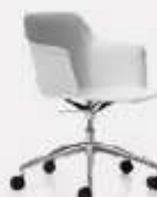
5 RACES TREND L70/43 P70/43 H97/80