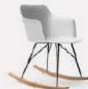
DONDOLO L58/43 P53/43 H75/42