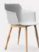
4 WOODEN LEGS L58/43 P54/43 H80/47