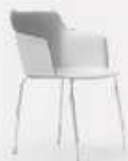
4 METAL LEGS L58/43 P54/43 H80/47