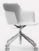
4 RACES LEGGERA L70/43 P70/43 H 97/80