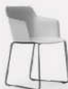
CANTILEVER L58/43 P54/43 H80/47