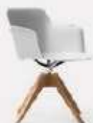
4 WOODEN RACES L70/43 P70/43 H 97/80