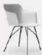
TRALICCIO L58/43 P53/43 H78/45